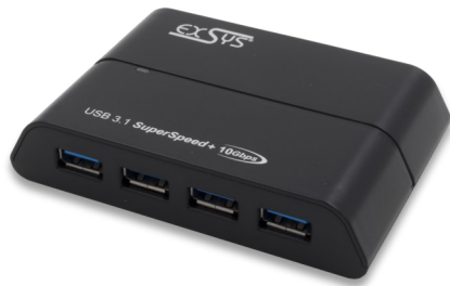
Figura / Picture