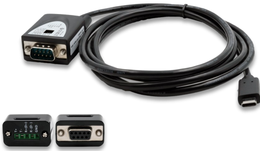
Inkl. Adapter 9 Pin Buchse zu 5 Pin TB Incl. Adapter 9 pin female to 5 pin TB