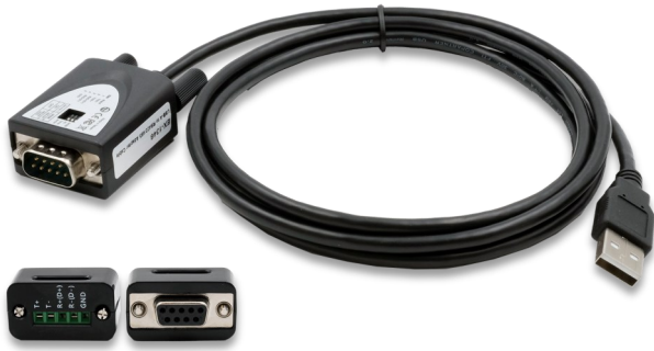
Inkl. Adapter 9 Pin Buchse zu 5 Pin TB Incl. Adapter 9 pin female to 5 pin TB