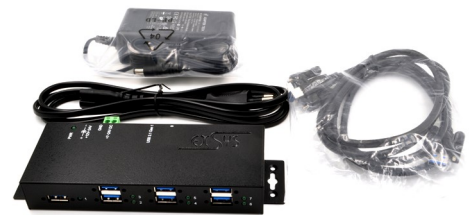
EX-K1110 - DC-Jack ~ Terminal Block